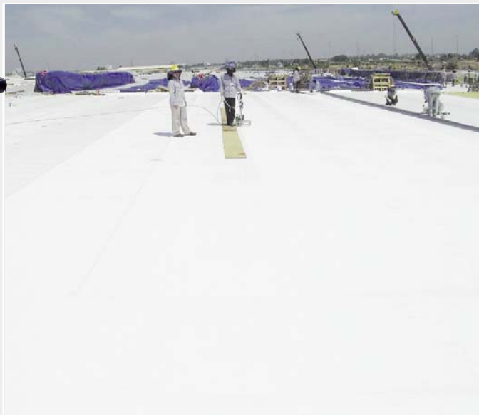
Sección del gigantesco techo plano.

Quien crea que no se ha valorado la calidad en esta obra está claramente equivocado: Como propietario del edificio, Intel especificó la obra en base a la norma Americana ASTM. Como resultado, los inspectores de Intel examinaron la resistencia de las soldaduras diariamente. Gracias a la posibilidad de registro de los parámetros