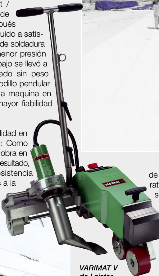
VARIMAT V de Leister.

El edificio gigante se ha terminado a tiempo. Alrededor de 1200 empleados de Intel trabajan allí. Pueden disfrutar de los beneficios de una climatización constante en el interior sabiendo que el tejado es totalmente estanco – soldado con la VARIMAT V de Leister.