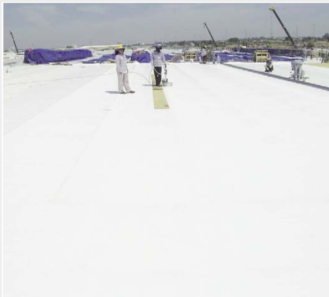
Ausschnitt des riesigen Flachdaches.

Wer glaubt, dass bei diesem Bauvorhaben kein Wert auf hohe Qualität gelegt worden ist, sieht sich getäuscht: Intel als Bauherr schrieb vor, dass die amerikanische ASTM-Norm erfüllt wurde. Täglich überprüften deshalb Inspektoren von Intel eine Schweissnaht auf ihre Dichtigkeit. Dank der reproduzierbaren