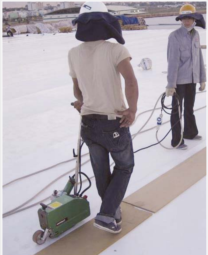
Um den Druck auszugleichen, wurde auf Brettern gehend verschweisst.

Intel hatte in der Ausschreibung den Einsatz der Kunststoffdichtungsbahn ENERGY STAR von Carlisle vorgeschrieben. Dieses TPO-Material reflektiert die Wärme der Sonnenstrahlen und hilft damit, wertvolle Energie zur Kühlung des Gebäudes zu sparen. Carlisle empfiehlt in seinen Vorgaben, die Überlappnähte mit Geräten von Leister zu verschweissen. Leister hat in Vietnam – wie in 90 anderen Ländern auch – einen autorisierten Vertriebspartner vor Ort. Hier ist dies Dong Loi Equipment & Service Co. Ltd. So kam es, dass der vietnamesische Unternehmer, AIM ProTech, das erste Mal mit Geräten von Leister arbeitete. Die Mitarbeiter von AIM ProTech wurden auf den VARIMAT V geschult und von Dong Loi auch auf dem Dach unterstützt. Die Verleger