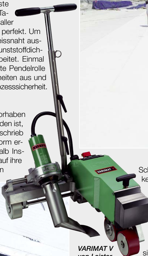
VARIMAT V von Leister.

Das riesige Gebäude ist mittlerweile fertig gestellt. Nun arbeiten hier rund 1200 Mitarbeiter von Intel. Sie können sich über ein gleich bleibendes Klima im Innern freuen und sicher sein, unter einem absolut dichten Dach zu arbeiten – geschweisst mit dem Schweissautomaten VARIMAT V von Leister.