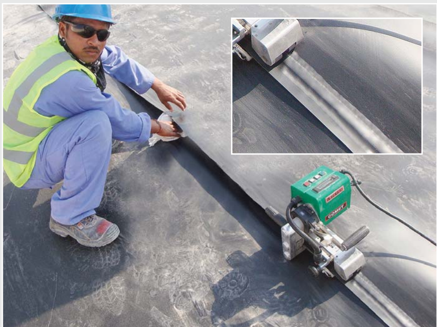
COMET realiza de hasta 1000 N dos soldaduras paralelas.

sistema de impermeabilización, se apilaron bloques de drenaje de plástico. Los bloques de drenaje son de polipropileno y tienen un tamaño de 740 x 400 x 420 mm (longitud x ancho x altura). El total de piezas alcanza la considerable suma de 17.670. Estas piezas soportan no sólo el sistema de impermeabilización con el agua recogida, sino también 3,7 m de tierra y arena excavada que volvió a echarse sobre el depósito tras su instalación, así como el aparcamiento más los coches de los clientes.