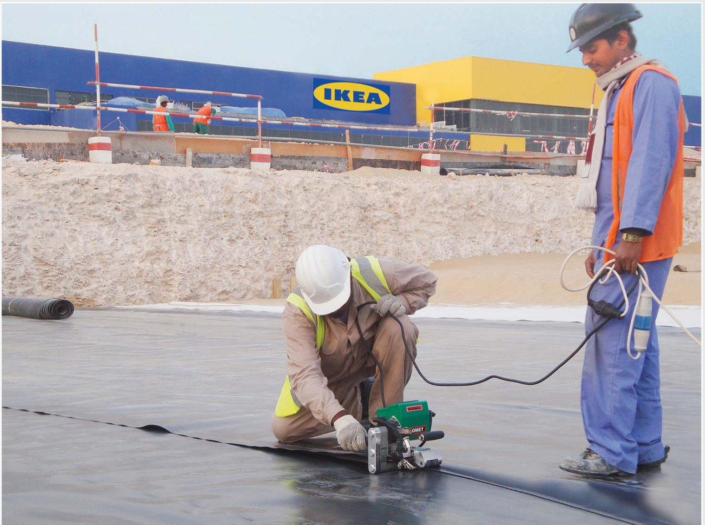
Sencillo manejo y trabajo nítido con la soldadora automática de cuña térmica COMET.

Bloques de drenaje de plástico como sistema de soporte Las medidas del depósito son 42,4 x 24,5 x 2,125 m (longitud x ancho x altura). Estas impresionantes dimensiones corresponden a un volumen de aproximadamente 2.200 m 3 . Una particularidad de este proyecto es la estructura de soporte. Directamente en la zanja de seis metros de profundidad, sobre una capa de arena de 15 cm de espesor y la parte inferior del