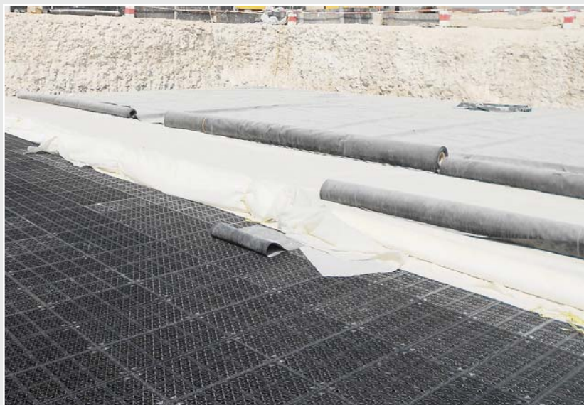
En primer plano, las cestas apiladas; detrás, el sistema de dos capas con geotextil y banda impermeable de HDPE.

Para los trabajos minuciosos en bordes, esquinas y conexiones de tubos, así como para la colocación de parches, la empresa QEMS empleó el extrusor manual de Leister FUSION 3. A diferencia de la soldadura a solape con las soldadoras automáticas, las piezas a soldar se unen aquí con material extruído. Para ello se introduce una varilla de soldadura de plástico en el extrusor manual, se trocea, se funde y se aplica como