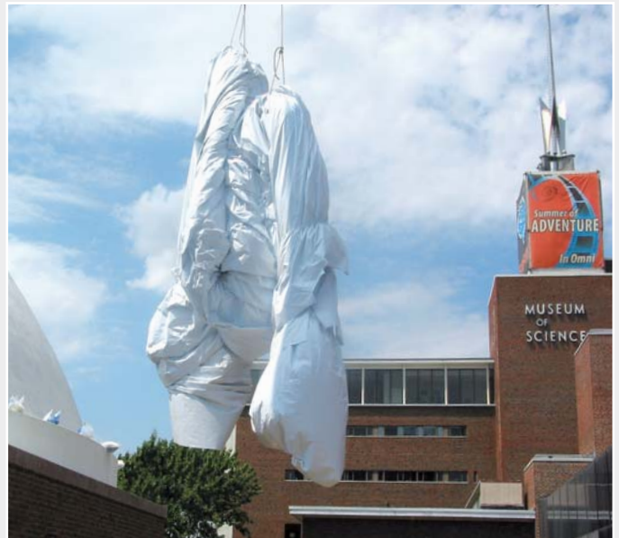
Hochhieven des ganzen Teils vom Flachdach auf die Kuppel.

Nachdem das erste Viertel einmal auf das Dach gehoben war, wurde es ausgerollt und flach ausgebreitet. Danach wurde das nächste Viertel hochgehoben, ausgerollt und neben dem ersten passend ausgelegt. Anschliessend wurden die zwei Stücke auf dem Museumsdach mit dem UNIPLAN E zusammengeschnitten. Das Vorgehen wiederholte sich mit den zwei verbliebenen Stücken. Um die perfekte Anpassung an die Kuppelform zu gewährleisten, wurde die schliessende Naht noch nicht verschweisst. Dies sollte erst auf der Kuppel selbst geschehen.