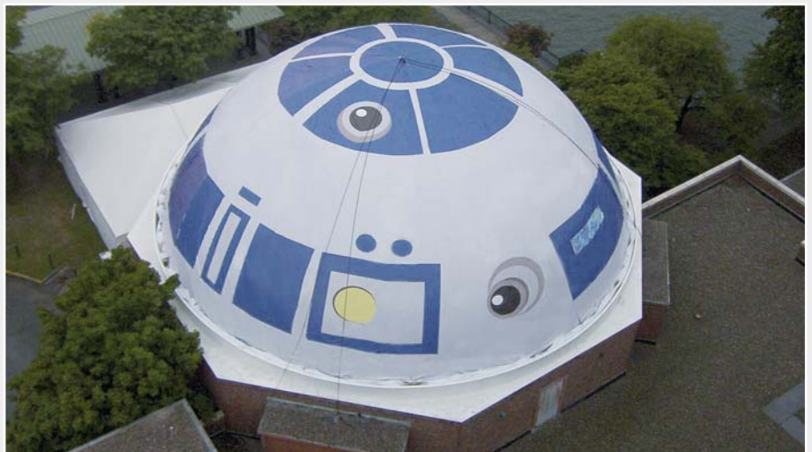
Die fertige R2D2-Kuppel mit einem Umfang von 60 Metern.