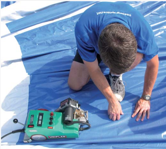
Verbinden der Viertelstücke mit dem UNIPLAN E.

rund 1.8 m breit. So musste jede dieser Planen aus zwei Stücken zusammengesetzt werden. Die einzelnen Bahnen wurden in seiner grossen Werkhalle bedruckt, nummeriert, ausgelegt und schliesslich zu Segmenten zusammengeschnitten. Als Nächstes wurden die zwanzig Planen zu Viertelkreisstücken von etwa 15 m x 14 m zusammengesetzt. Der UNIPLAN E wurde bei allen Schweißaufgaben eingesetzt, da er für die speziellen Anforderungen des Auftrags perfekt geeignet war. Aufgrund der Form der Viertelstücke und der Kuppelform mussten die Planen rund geschweisst werden. – Eine Aufgabe, die sich mit dem UNIPLAN E lösen lässt.