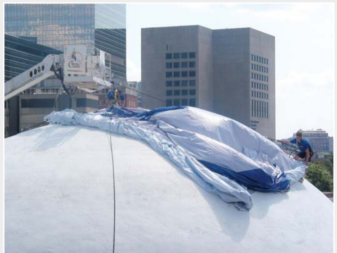
Ausrollen der riesigen Plane auf der Kuppel.

Nachdem Medien und Schaulustige abgezogen waren, blieb King noch zurück, um die letzte Naht zu verschweissen und einige Falten auszubügeln. Die vollständige „R2D2“-Kuppel besteht aus über 2500 m Planenmaterial. Über 600