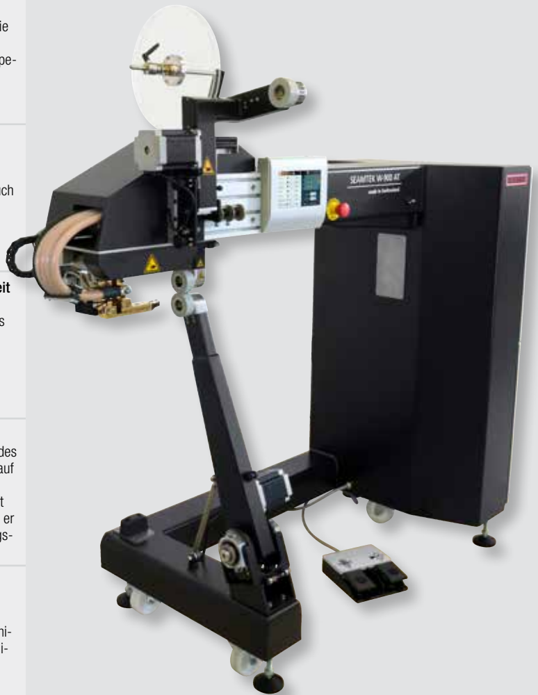
LEISTER SEAMTEK W-900 AT