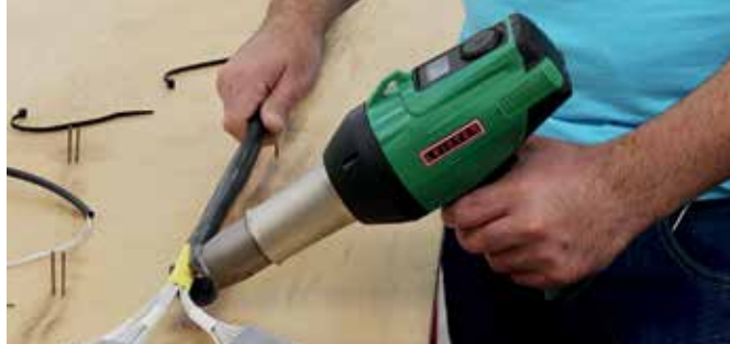
Schrumpfen in der Kabelkonfektion – ideal mit dem GHIBLI AW

werden. Der mitgelieferte Standfuss und die praktische Geräteaufhängung erleichtern das Arbeiten. Die Luftfilter lassen sich einfach entfernen und reinigen. Und natürlich passen alle Düsen seines Vorgängers auf den GHIBLI AW.