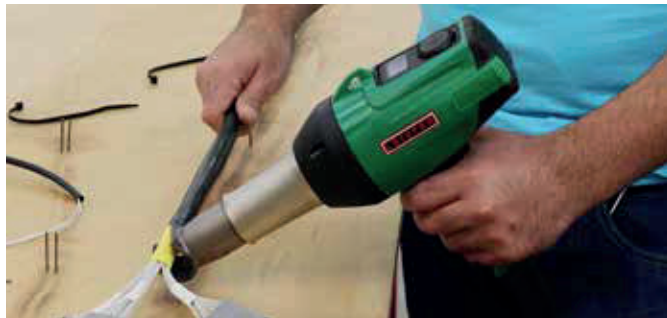
Schrumpfen in der Kabelkonfektion – ideal mit dem GHIBLI AW

werden. Der mitgelieferte Standfuss und die praktische Geräteaufhängung erleichtern das Arbeiten. Die Luftfilter lassen sich einfach entfernen und reinigen. Und natürlich passen alle Düsen seines Vorgängers auf den GHIBLI AW.