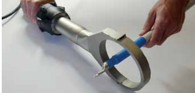
Das Schrumpfen von Kabelitzen ist eine von vielen Anwendungen mit dem ELECTRON ST.