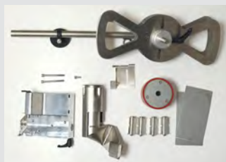
Kit de reequipamiento de VARIANT T1 de solapado a VARIANT T1 BANDA 50 mm N.º art.: 148.962