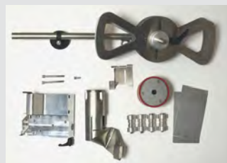
Kit de reequipamiento de VARIANT T1 de solapado a VARIANT T1 BANDA 25 mm N.º art.: 148.961