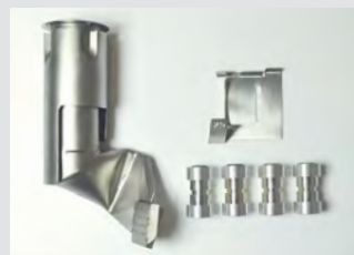
Kit de reequipamiento de VARIANT T1 BANDA 50 mm a VARIANT T1 BANDA 25 mm N.º art.: 149.653