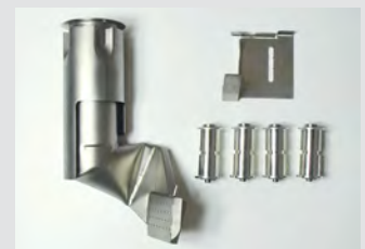
Kit de reequipamiento de VARIANT T1 BANDA 25 mm a VARIANT T1 BANDA 50 mm N.º art.: 149.652