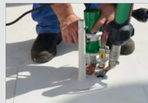
Details mit engen Radien