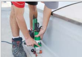
Attika-nahes Schweißen an Lichtkuppeln