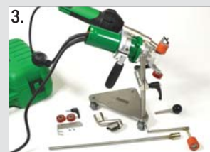
Version mit Führungshilfe und Verlängerung für das Attika-Schweißen