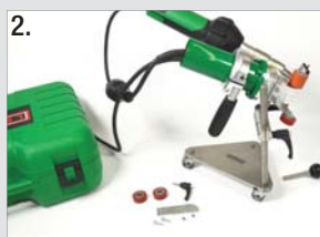
Version mit Führungshilfe für das Attika-Schweißen