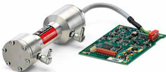
LGD OEM compact module