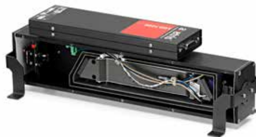
LGD F200 OEM 模块, 内视图

Axetris 的激光气体检测器模块是一款独立式的, 易于 OEM 系统集成的, 可检测选定气体的核心模块。该模块是基于可调谐二极管激光光谱技术 (TDLS), 这种技术已经在一些高端的实验室及现场过程控制等应用中证明了其可靠性。它的主要工作原理是用激光束去扫描指定目标气体具有极高分辨率的吸收谱线区域, 从而能实现非常精准地测量目标气体的浓度。Axetris 的这种独有专利技术使 TDLS 技术实现了低成本, 批量使用于相关的气体检测应用: 其主要原因是采用了低成本的通讯类激光器作为光源, 结合了 Axetris 公司无参比通道的专利结构设计, 并减少了部分通用部件的使用, 从而造就了适用于多种应用的高性价比产品。