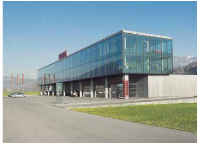
莱丹集团公司总部, 瑞士

我们的多领域应用知识, 富有经验的研发及生产团队, 从MEMS 器件到先进的光电传感模块的研发, 生产, 计量中积累了广泛的经验。Axetris 可为客户提供相关应用的深层次技术支持。客户可从优秀的产品附加值, 高品质的产品及出色的技术支持中直接获益。Axetris是全球OEM用户最可靠的合作伙伴, 可为客户提供从产品设计到批量生产的定制方案。Axetris通过了ISO 9001:2015认证, 拥有自己的6"- 8" 晶片MEMS 铸造基地, 生产自有产品, 也可为客户提供代加工服务。晶片的后端加工, 传感器的装配及标定设备都在Axetris公司高标准配置的洁净室中进行。