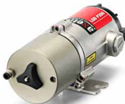
LGD point detector