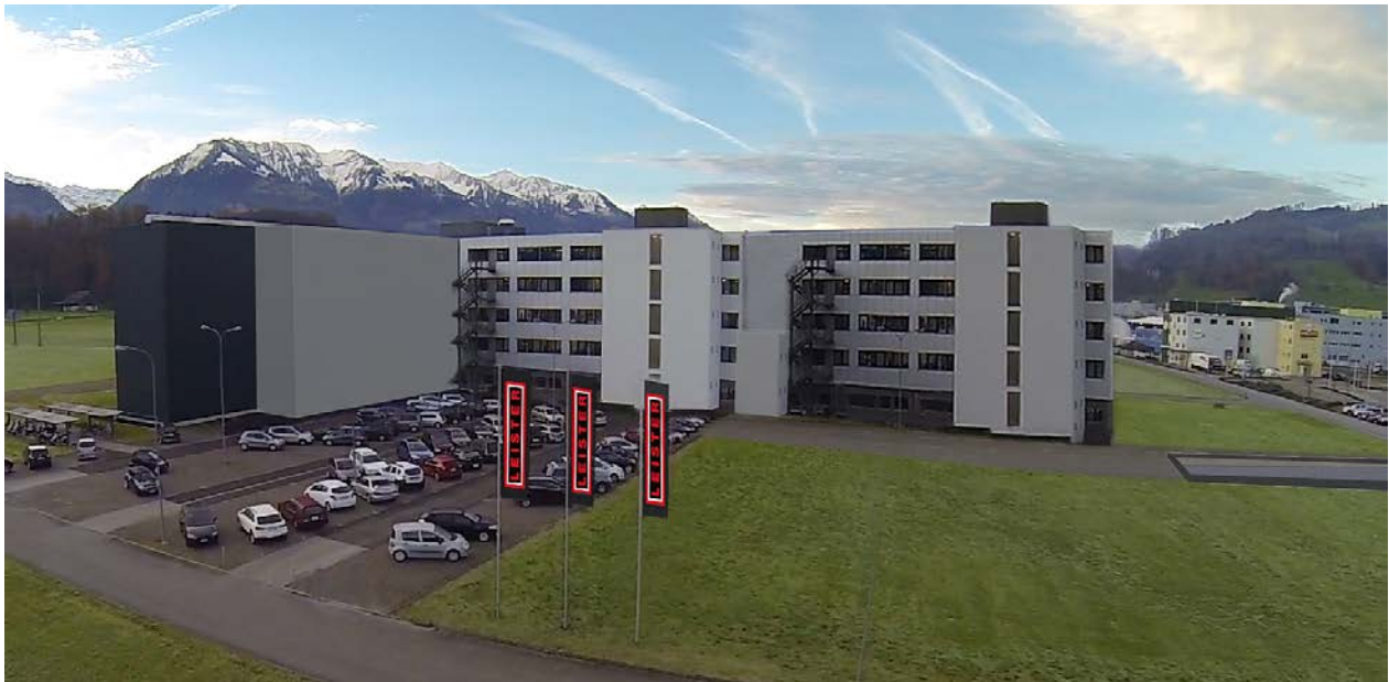
Blick auf das Gebäude Sarnen Ried ab 2019 mit Anbau Produktionsgebäude und automatischem Kleinteilelager

Der neue Gebäudekomplex für die Leister Technologies AG soll im Frühjahr 2019 bezugsbereit sein.