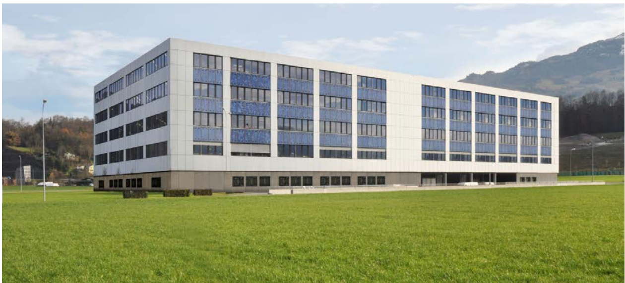
Südseite des Gebäude Sarnen Ried mit Erweiterungsbau